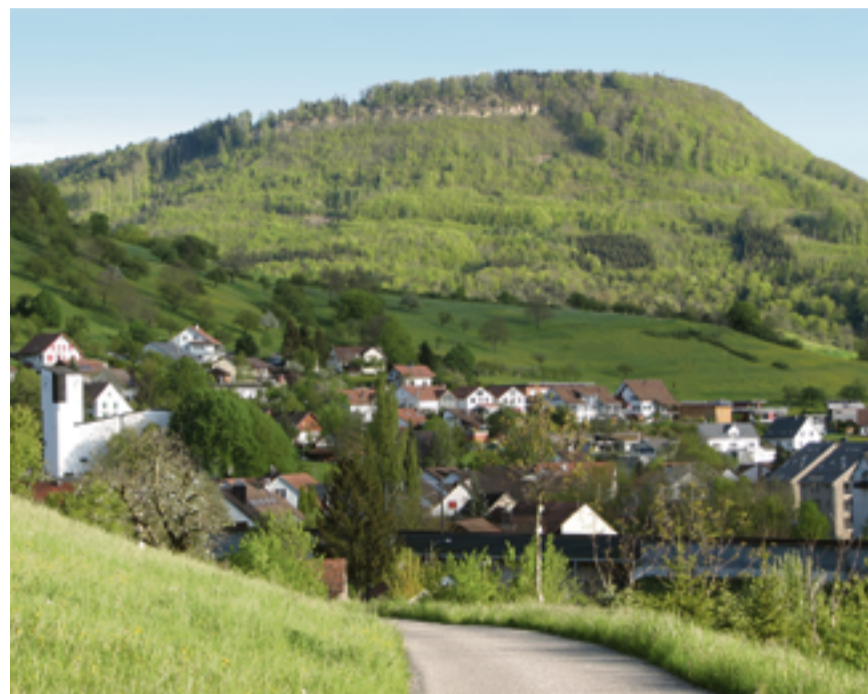
Die Gemeinde Zeihen liegt inmitten schönster Natur.

Alles weitere auf oder in der Schatztruhe.