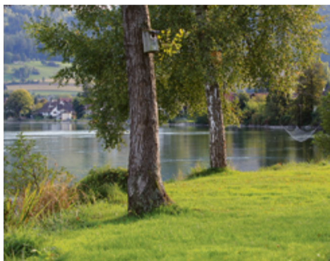
Idyllische Plätze laden in Wallbach zum Verweilen ein.