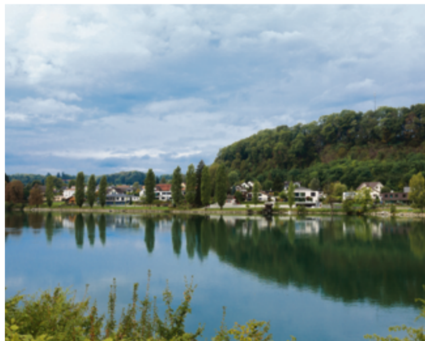
Die Gemeinde Wallbach liegt am Ufer des Rheins.